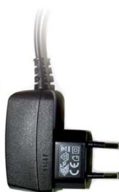
Alimentatore da parete