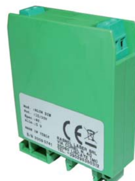
Alimentatore da quadro elettrico