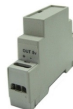
Alimentatore da quadro elettrico