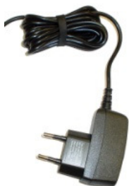
Alimentatore da parete